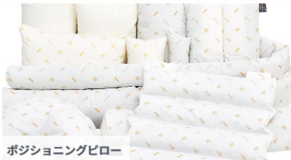
ポジショニングピロー