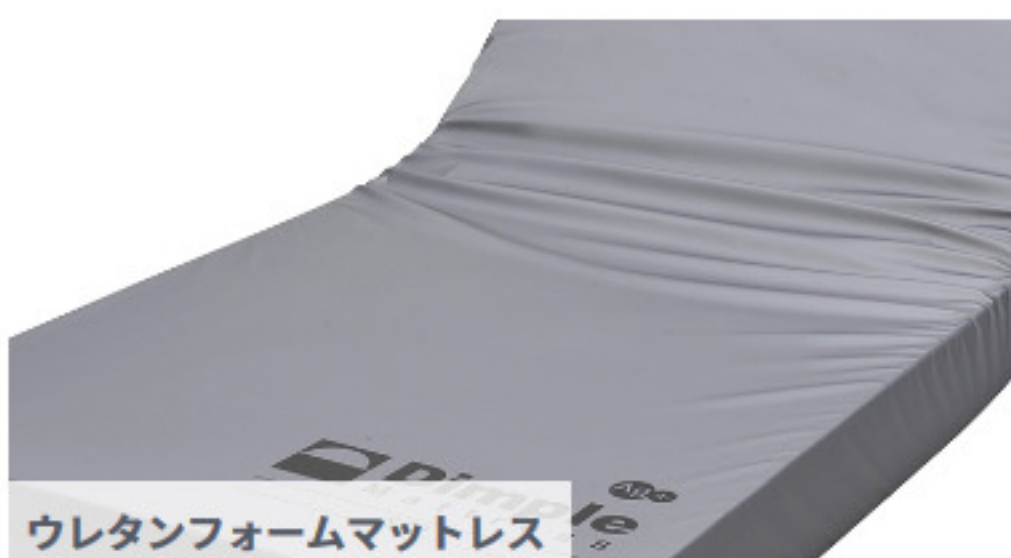
ウレタンフォームマットレス