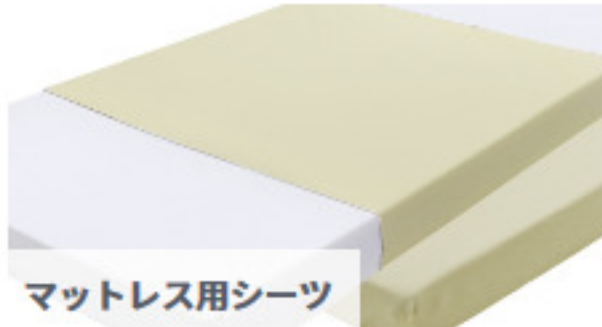
マットレス用シーツ