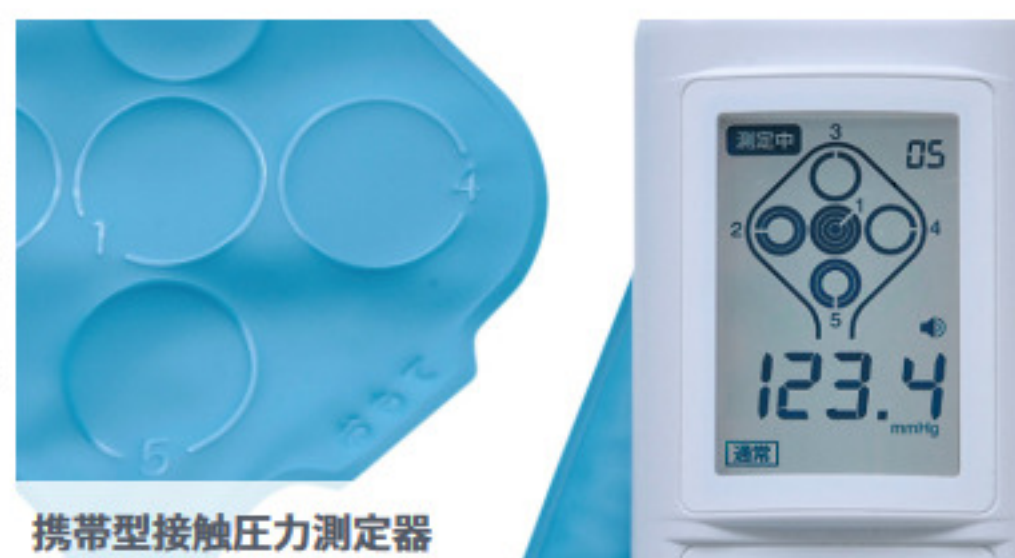
携帯型接触圧力測定器