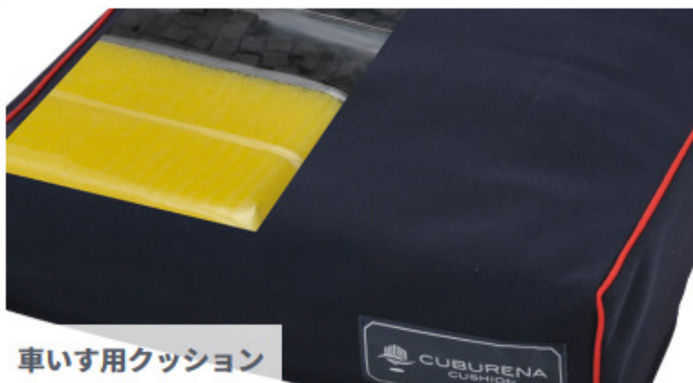
車いす用クッション