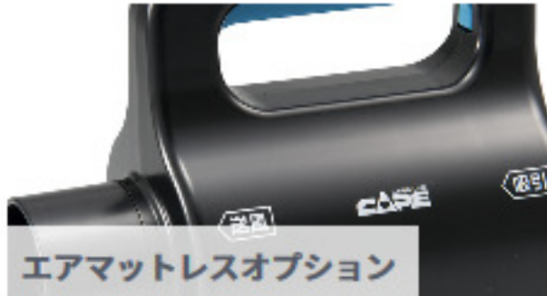
エアマットレスオプション