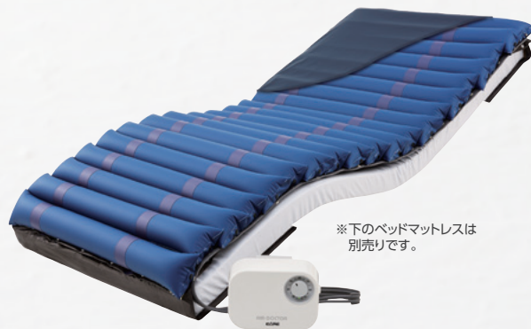
※下のベッドマットレスは別売りです。