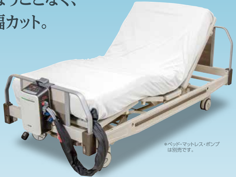
*ベッド・マットレス・ポンプは別売です。