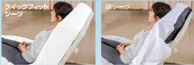
クイックフィットシート

頭部ボックス形状により、頭側挙上を繰り返してもズレが生じにくいです。掛け直しに費やしていた時間を他の業務に充てられ、作業効率がグーンとアップします。