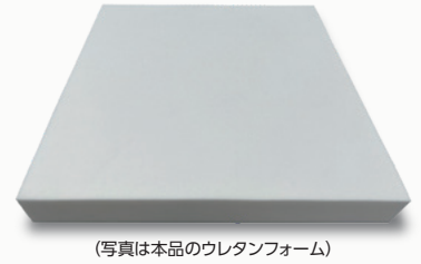
(写真は本品のウレタンフォーム)