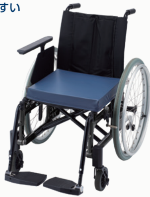
*写真は使用例です。